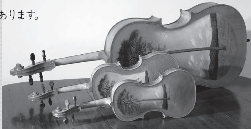
津波ヴァイオリン[2012.3製作] 津波ヴィオラ[2013.7製作] 津波チェロ[2013.10製作]